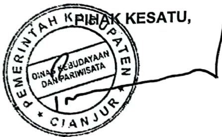
PRATAMA NUGRAHA EMMAWAN